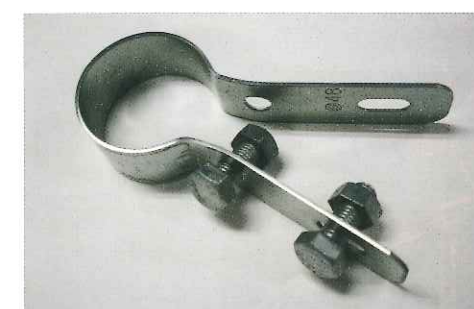
妻用ユニバーサル(48.6φ) ZAM