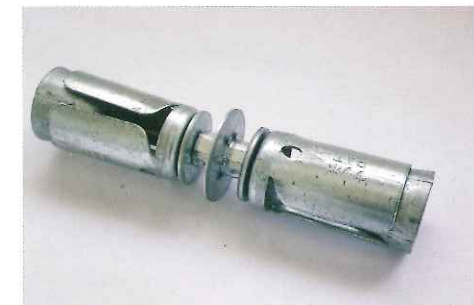
ウツブスーパーユニファイ 48.6φ