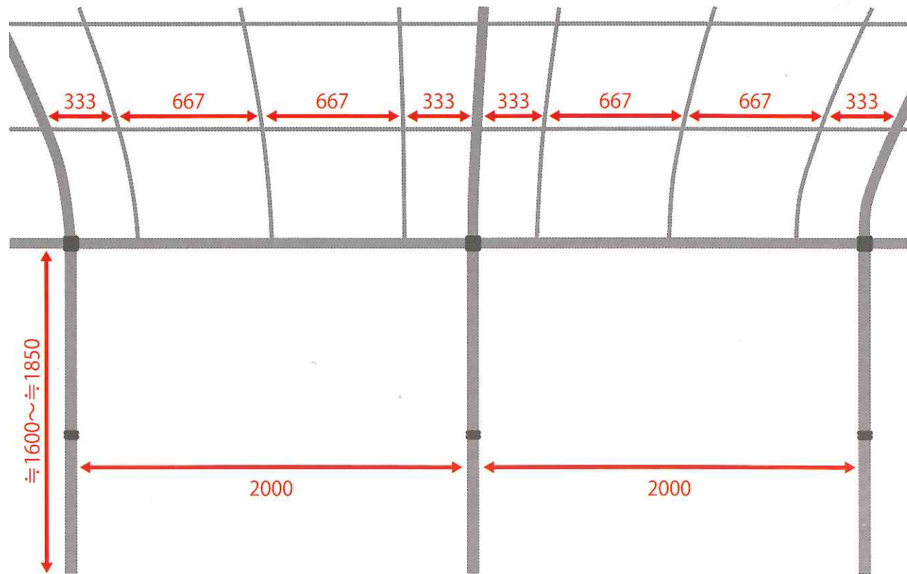
※連棟部谷下イメージ図