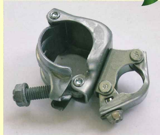
ヒラトトップ 48.6φ×25.4φ(自在) ZAM

天母屋に 48.6φの直管を取付けるために使用し同径のアーチジョイントに固定します。