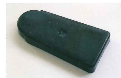
メタルキャップ(25.4φ×48.6φ用)

25.4φ×48.6φの妻面に位置するパイプクロスを専用のキャップで保護します。