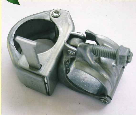
ヒラトトップ 48.6φ×48.6φ(直交) ZAM

天母屋に 48.6φの直管を取付けるために使用し同径のアーチジョイントに固定します。