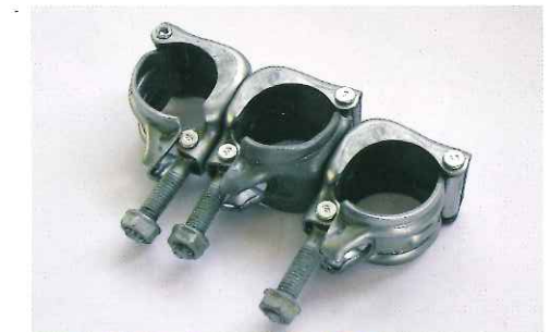
三連自在クランプ ZAM