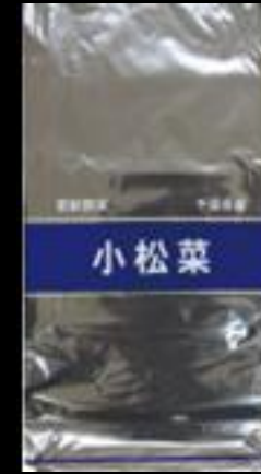
千葉県産 小松菜 FG #20 200x350