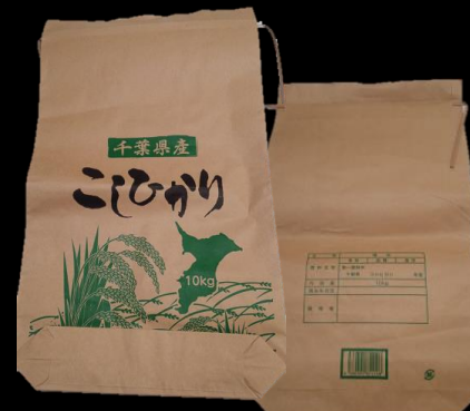
千葉県産 こしひかり 米袋 10kg 560x330x75mm