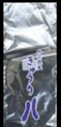
千葉県産 きゅうり FG #20 150x350 4穴