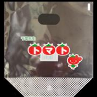
③0 千葉県産 トマト スタンドパック #40 200x220 GZ 45