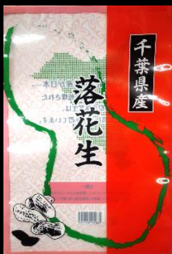
③1 千葉県産 落花生 大(500g用) 230x330