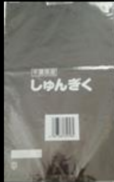
千葉県産 春菊 FG #20 170x270