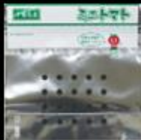
②6 千葉県産 ミニトマト 200g用FG 多孔 #40 140x(25+115 GZ 30)