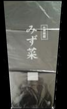
千葉県産 水菜 FG #20 265/150x450