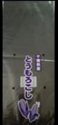
②4 千葉県産 とうもろこしFG #20 150x370 4穴