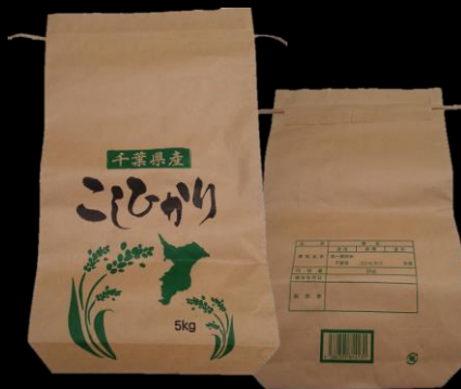
千葉県産 こしひかり 米袋 5kg 470x280x75mm