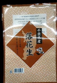
③2 千葉県産 落花生 中(殻付300g用) 200x290