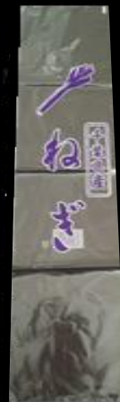
千葉県産 ねぎ FG #20 150x650 2穴