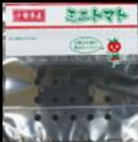
②5 千葉県産 ミニトマト 100g用FG 多孔 #40 120x(25+95 GZ 30)