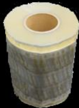
②1 千葉県産 イチゴロール #25 220x300 ピッチ150