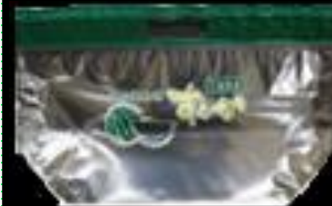
②8 千葉県産 カットスイカ用 スタンドパック #50 360x215 GZ 75