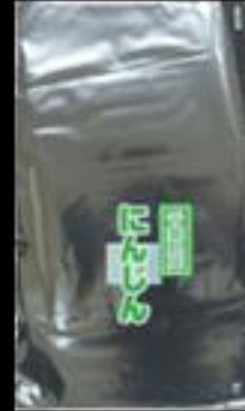
千葉県産 人参 FG #20 180x300