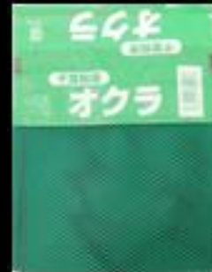
②2 千葉県産 オクラネット テープ付 130x110+90