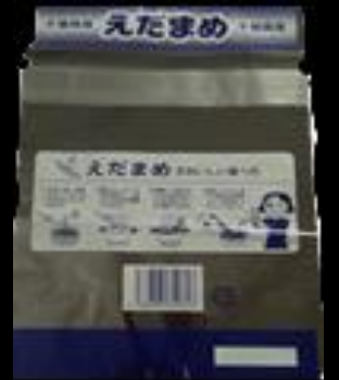
千葉県産 枝豆 (枝無300g)FG #25 160x210+35+35