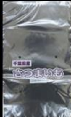
千葉県産 サツマイモ FG #20 180x300 4穴