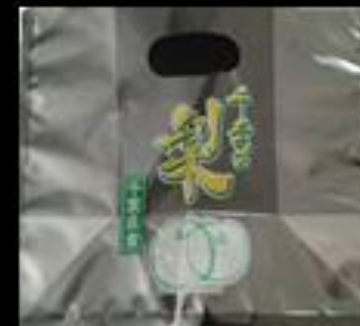
②9 千葉県産 梨 スタンドパック #40 240x190 GZ 65