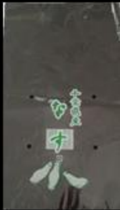
①9 千葉県産 なすFG #20 200x320 4穴