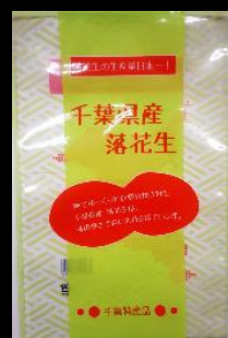
③3 千葉県産 落花生 小(300g用) 180x270