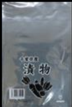
千葉県産 漬物 10号袋 0.05x180x270