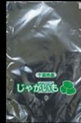
②3 千葉県産 じゃがいもFG #20 200x300 4穴