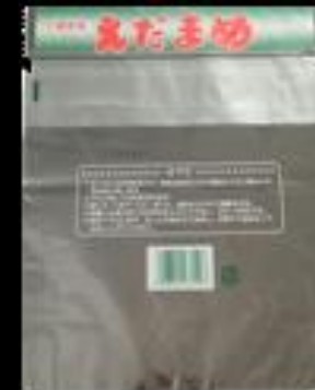
千葉県産 枝豆 (枝付300g)FG #25 200x250(220x35)+40