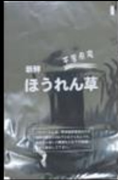
千葉県産 ほうれん草M FG #20 200x300