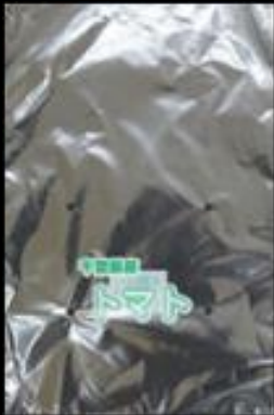
千葉県産 トマト FG #20 200x300 4穴