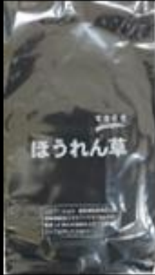
千葉県産 ほうれん草L FG #20 200x350