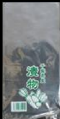
千葉県産 漬物 7号袋 0.05x150x300