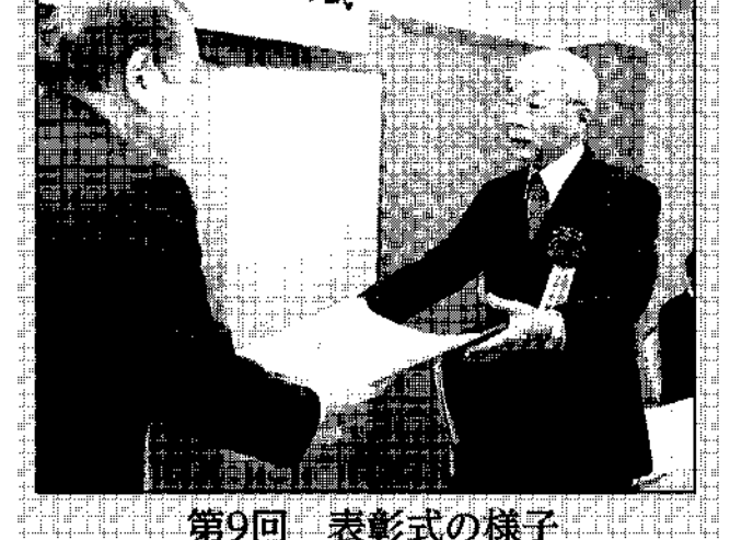
第9回 表彰式の様子