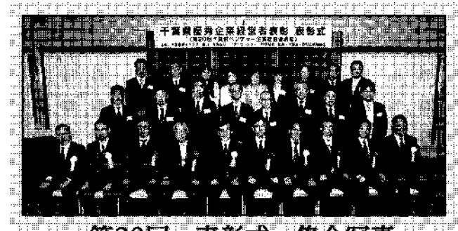
第20回 表彰式 集合写真