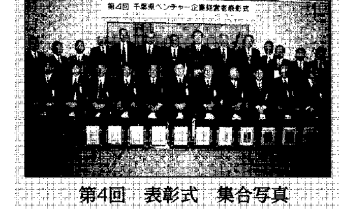
第4回 表彰式 集合写真