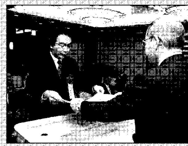
第11回 表彰式の様子